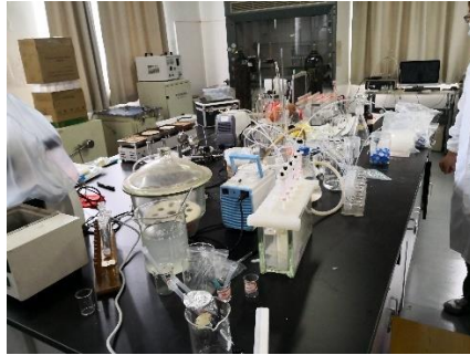
水利馆 D303（固废研究二室）：接线板直接置于地面，线路使用不规范。